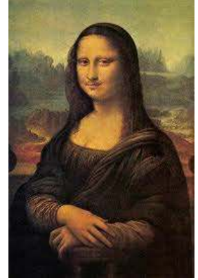
- العمل -1-

السؤال الثاني: يقول مارغريت ملخصاً فلسفته الفنية: