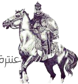
عنترة بن شداد العبسي