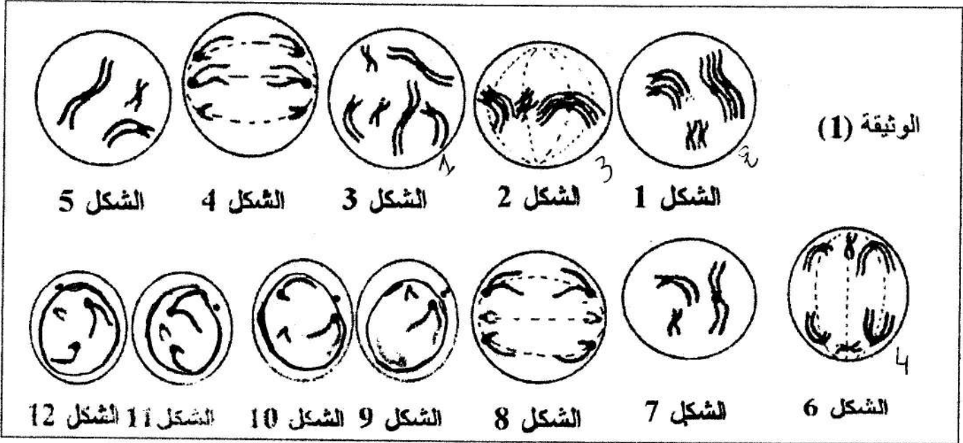
الوثيقة (1) الشكل 1 الشكل 2 الشكل 3 الشكل 4 الشكل 5

I - تمثل الوثيقة (1) بعض المظاهر الخلوية في أكياس طلعية لنبات الذرى .