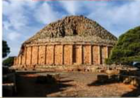
الضريح الملكي (تيبازة)