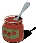
Une con f v iture