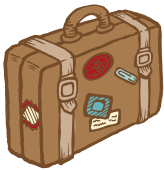
Une f v alise