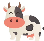
Une f v ache