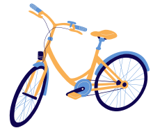
Un f v élo