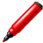
Un f v eutre