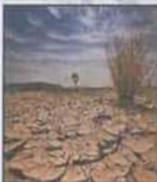
التصحر و الجفاف

ضع تحت كل صورة نوع المشكل الذي تواجهه الجزائر :