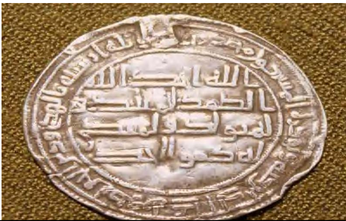
الصورة 02: صورة لدرهم من العصر الأموي يرجع تاريخه الي سنة 106 هجرياً (724 م)

التعليمة 02: من خلال الصور التالية استنتج انواع الوثائق التاريخية