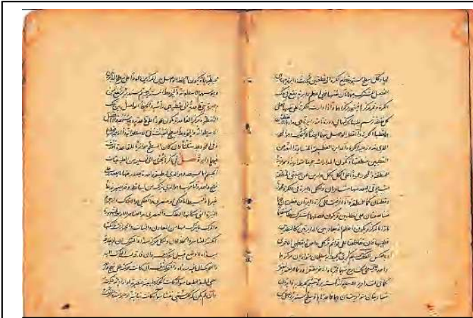
الصورة 04: مخطوط لكتاب عربي