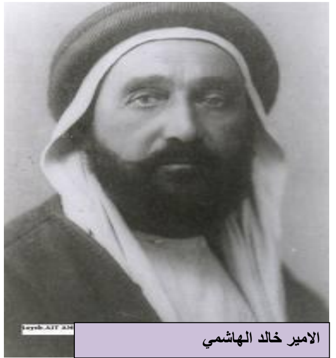
الامير خالد الهاشمي

الوثيقة 02: الأمير خالد بن الهاشمي حفيد الامير عبد القادر ولد بمدينة دمشق بسوريا يوم 20 فيفري 1875 مناضل سياسي جزائري أثناء الإستعمار الفرنسي و متقاعد من الجيش الفرنسي . تصدى لدعاة الإدماج و التجسس، وأسس حزب الشباب الجزائري سنة 1919 وطالب بالمساواة بين الجزائريين والفرنسيين ثم أنشأ حزب الإخاء الجزائري 1922م. وعند زيارة الرئيس الفرنسي ميليران اليكسندر Millerand Alexandre إلى الجزائر في مارس 1923 خطب الأمير خالد أمامه مجددا مطالب الجزائريين. هذا النشاط المكثف جعل الحكومة الفرنسية تصدر أمراها بنفي الأمير خالد إلى خارج الجزائر في جويلية 1923. وظل يرأس الحكومة الفرنسية من منفاه توفي بدمشق 09 جانفي 1936.