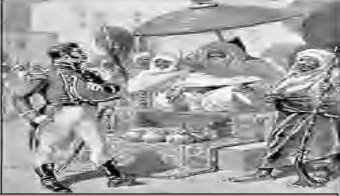
الصورة 02: القنصل الامريكي يدفع الجزية لداي الجزائر

1- استنتج الذرائع و المبررات للاحتلال الفرنسي للجزائر 2- استنتج الاسباب الحقيقية للاحتلال الفرنسي للجزائر