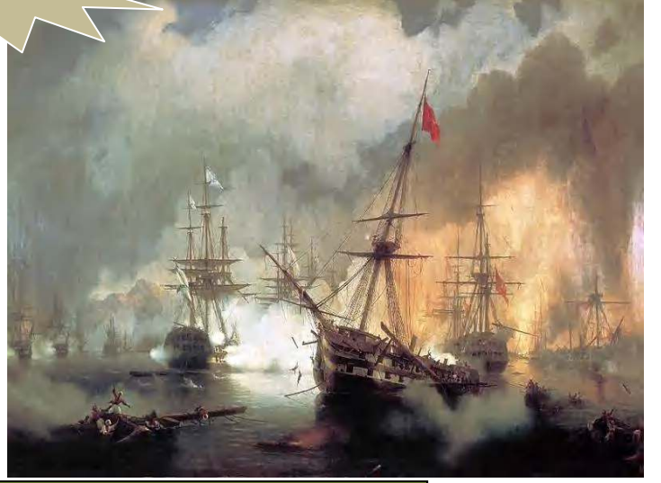
الصورة 05: تحطم الاسطول الجزائري في معركة نافرين 1827م