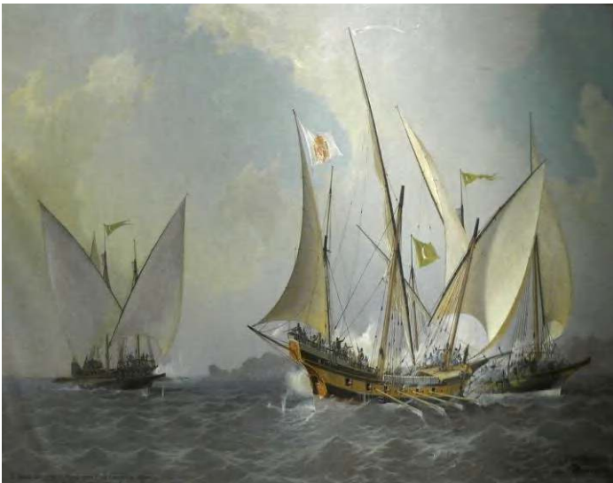
الصورة 04: نشاط الاسطول الجزائري بالبحر المتوسط (محاصرة الاسطول الجزائري لسفينة حربية اسبانية)