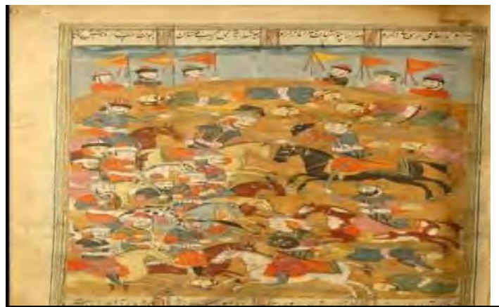
الصورة 01: لوحة فنية تمثل إحدى المعارك الحربية التي خاضها المسلمون ضد الامبراطورية الفارسية