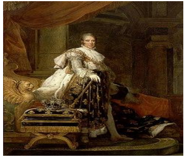
الصورة 03: الملك شارل العاشر المستبد (1757 - 1836) كان نظامه رجعي وسيء وكان هذا سببا في وجود معارضة قوية و تدهور اوضاع شعبه