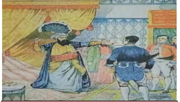
الصورة 01: حادثة المروحة 29 افريل 1827 بين الداى حسين و القنصل الفرنسي دوفال

الوثيقة 01: نشرت جريدة لومنيطور الشبه الرسمية أسباب الحملة الفرنسية :