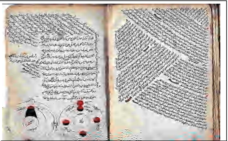
الصورة 03: خطوط لكتاب عربي في علم الهندسة والفلك في القرن 18 م