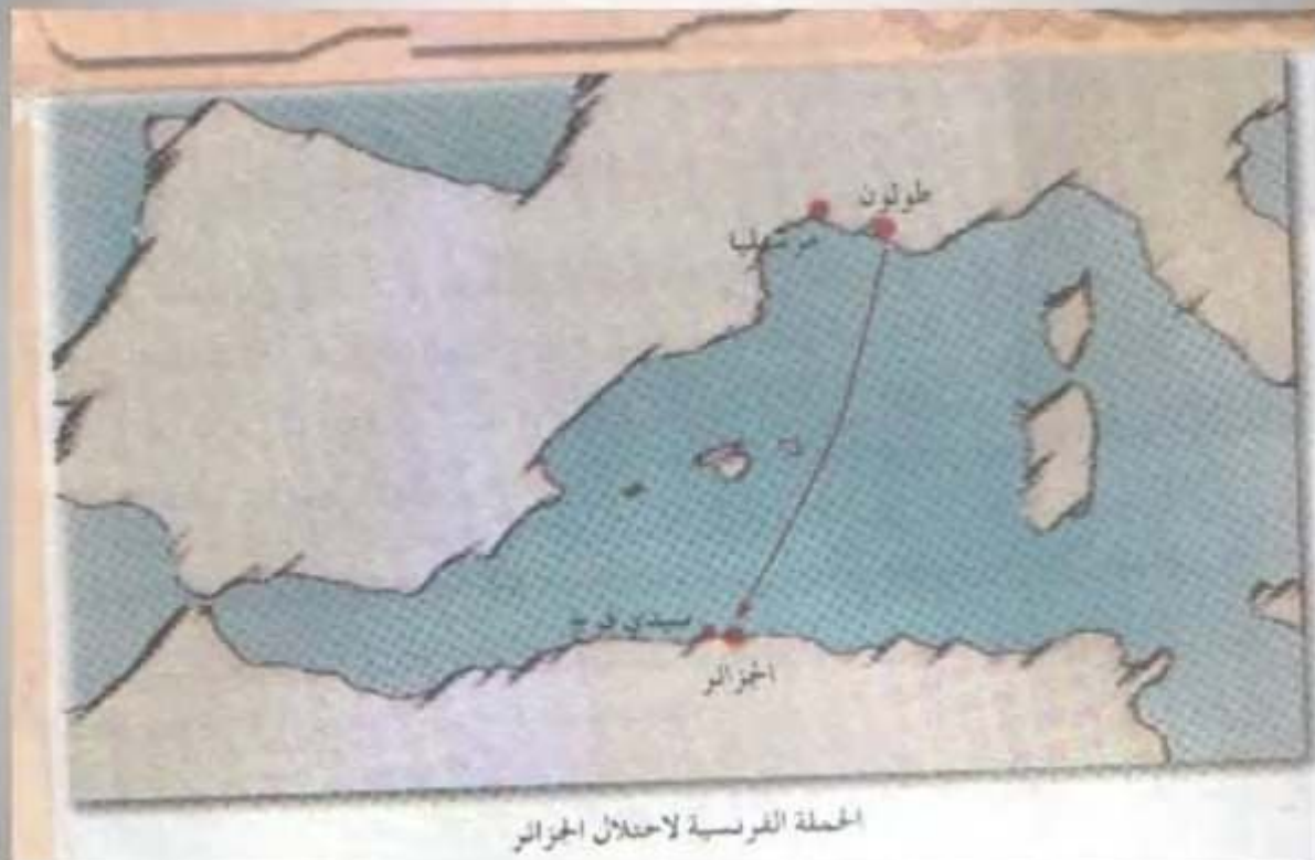
الحملة الفرنسية لاحتلال الجزائر