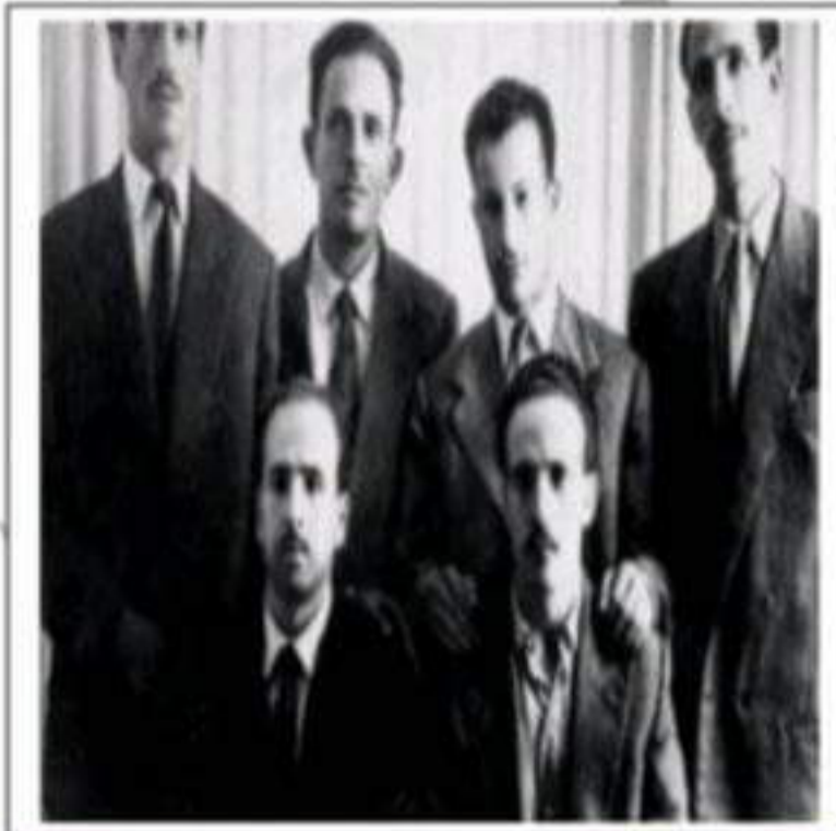
المجموعة الستة مفجري الثورة