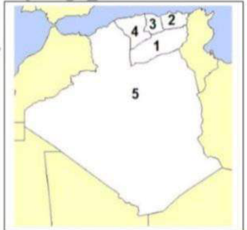
خريطة المناطق العسكرية قبل مؤتمر الصومام