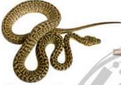
الافعى (مستهلك 2)