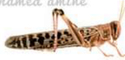
الجراد (مستهلك 1)