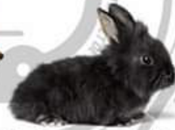
الارنب (مستهلك 1)