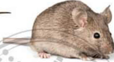
الفأر (مستهلك 1)