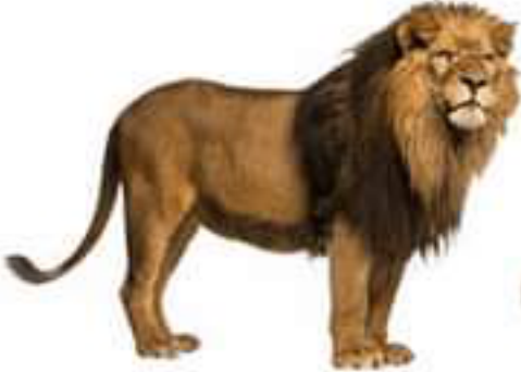
الاسد (مستهلك 3)