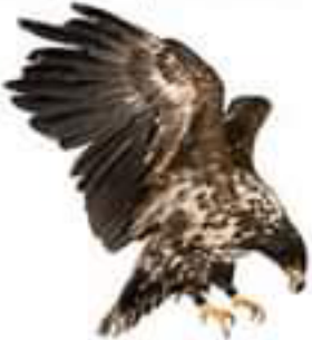
الصقر (مستهلك 3)