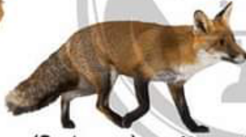
الثعلب (مستهلك 2)