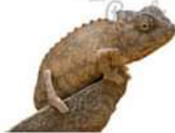
الحرباء (مستهلك 2)