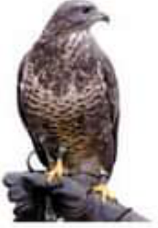
الصقر (مستهلك 3)