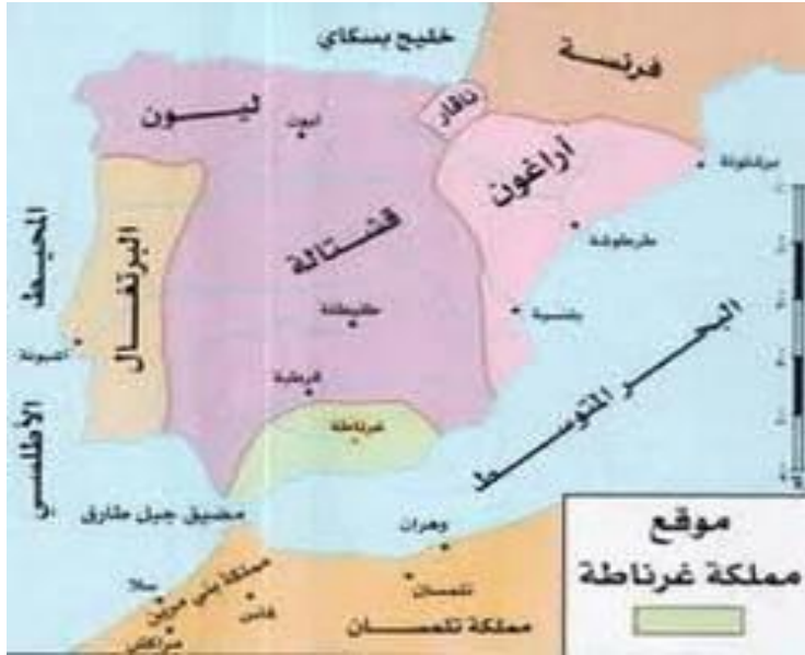
السند : 02