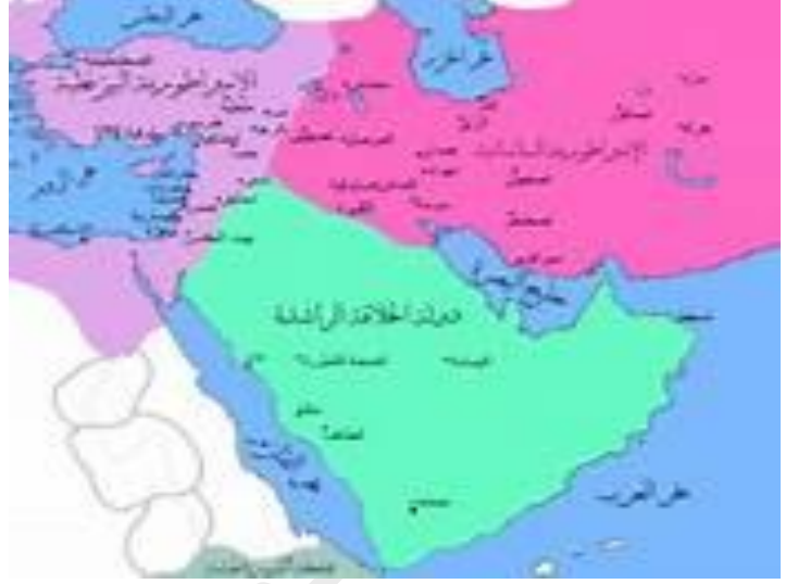
السند : 01

توالى على حكم الدولة وهم: أبو بكر الصديق وعمر بن الخطاب وعثمان بن عفان وعلي بن أبي طالب، يُضاف إليهم الإمام الحسن بن علي بن أبي طالب