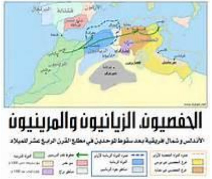
السند : 01

غرناطة) بالإسبانية (Granada : هي مدينة و عاصمة مقاطعة غرناطة في منطقة أندلوسيا جنوب إسبانيا. تقع بمحاذاة جبال سييرا نيفادا، عند نقطة التقاء نهري هُدْرَه وسَنْجَل، وعلى ارتفاع 738 متراً فوق سطح البحر. يبلغ عدد سكانها حوالي 240.099 نسمة، يعمل معظمهم في قطاع الزراعة والسياحة.