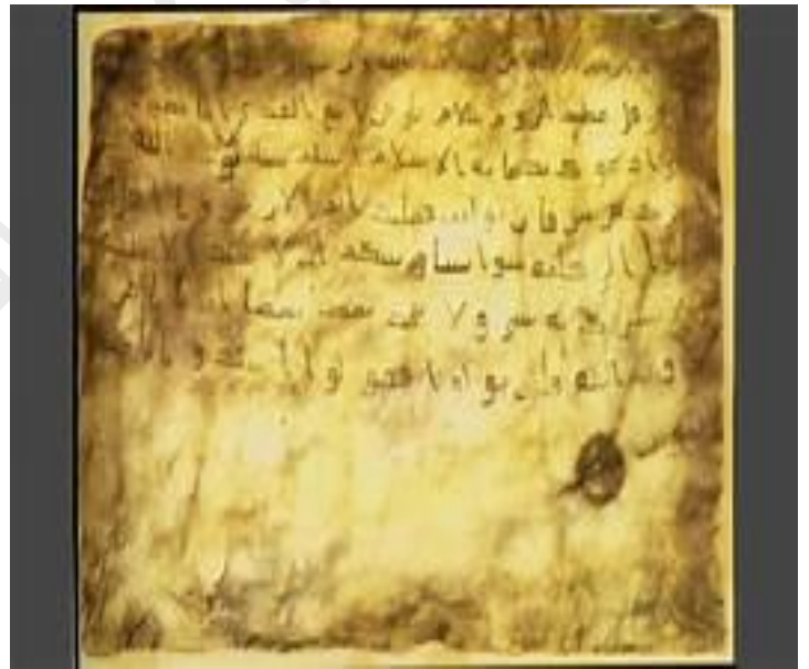
بعض الوثائق التي يحتويها المركز