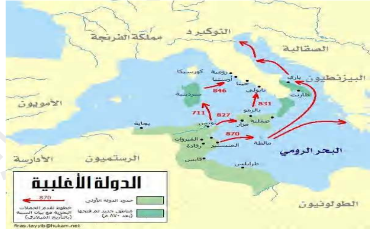
السند : 03

لدولة المرابطية هي دولة إسلامية ظهرت خلال القرن الخامس والسادس الهجري في منطقة المغرب الإسلامي . انبثقت من حركة دعوية إصلاحية إسلامية اعتمدت في بدايتها على العصبية الصنهاجية بعد التحام عدد من قبائلها الكبيرة. تحول هذا الالتحام إلى سند شعبي لم يلبث بدوره أن تحول إلى سند عسكري أفضى في النهاية إلى نشوء قوة إقليمية اقتصادية لسيطرة تلك القبائل على عدد من الطرق التجارية