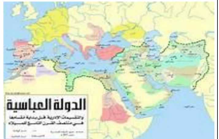
السند : 05

الخلافة العباسية أو العباسيون هو الاسم الذي يُطلق على ثالث خلافة إسلامية في التاريخ، وثاني السلالات الحاكمة الإسلامية. استطاع العباسيون أن يزحوا بني أمية من دربهم ويستفردوا بالخلافة، وقد قضاوا على تلك السلالة الحاكمة وطاردوا أبناءها حتى قضاوا على أغلبهم ولم ينج منهم إلا من لجأ إلى الأندلس، ، فاستولى على شبه الجزيرة الأيبيرية، وبقيت في عقبه لسنة 1029 م.