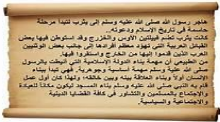
السند : 01