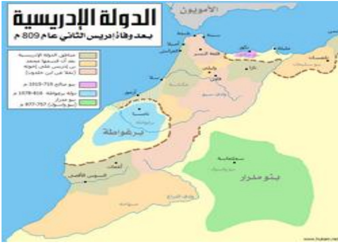
السند : 02