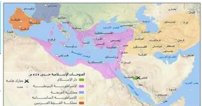
السند : 01