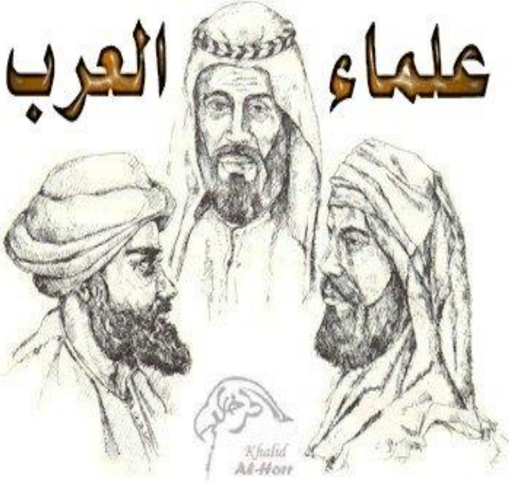
السند : 02