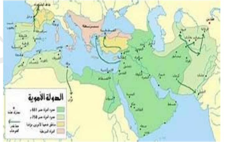
السند : 03

الخلافة الأموية أو دولة بني أمية : 132 - 41 هـ - 662 - 750 م) هي أكبر دولة وثاني خلافة في تاريخ الإسلام، وواحدة من أكبر الدول الحاكمة في التاريخ. كان بنو أمية أولى الأسر المسلمة الحاكمة، إذ حكموا من سنة 41 هـ (662 م) إلى 132 هـ (750 م)، وكانت عاصمة الدولة في مدينة دمشق. بلغت الدولة الأموية ذروة اتساعها في عهد الخليفة العاشر هشام بن عبد الملك،