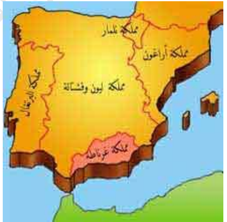
السند : 03