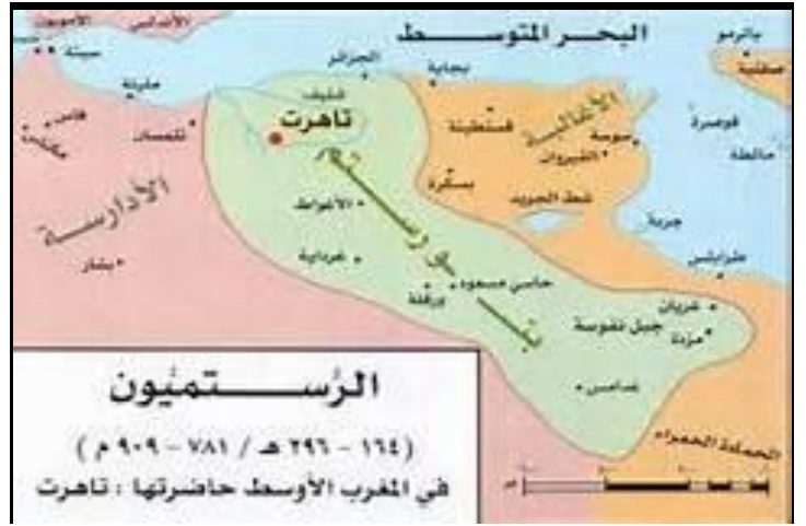
السند : 01

اختلفت المصادر التاريخية حول تحديد نسب الفاطميين، فمعظم المصادر الشيعة تؤكد صحة ما قال به مؤسس هذه السلالة، الإمام عبّيد الله المهدي بالله، وهو أنّ الفاطميين يرجعون بنسبهم إلى مُحَمَّد بن إسماعيل بن جعفر الصادق، فهم بهذا علويّون، ومن سلالة الرسول مُحَمَّد عبر ابنته فاطمة الزهراء ورابع الخلفاء الراشدين الإمام عليّ بن أبي طالب .