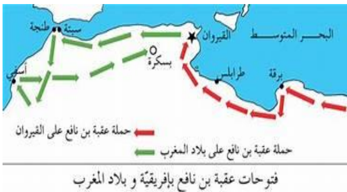
السند : 02

عقبة بن نافع الفهري من أبرز قادة الفتح الإسلامي الذين فتحوا بلاد المغرب لقب بفتح افريقية برز اسمه مبكراً في ساحة الأحداث في عهد الخليفة عمر بن الخطاب، حيث اشترك رفقة أبيه نافع في الجيش الذي توجه لفتح مصر بقيادة عمرو بن العاص، ولما توسم فيه خيراً وشأناً في حركة الفتح، أسندت إليه مهمة قيادة دورية استطلاعية لدراسة إمكانية فتح الشمال الأفريقي، وتأمين الحدود الغربية والجنوبية لمصر و ولاءه عمرو بن العاص برقة بعد فتحها. ورغم تعاقب الولاة على مصر، فقد أقروا جميعهم أحقية عقبة بن نافع في منصبه كقائد لحامية برقة، وظل في منصبه، موجه اهتمامه على الجهاد ونشر الإسلام بين قبائل البربر ورد غزوات الروم، وفي العهد الأموي كلف بحملات جديدة إلى الشمال الأفريقي لمواصلة الفتح الإسلامي واستطاع وجنوده أن يقضوا على الحاميات الرومية المختلفة في منطقة الشمال الأفريقي وبنى مدينة القيروان عام 50هـ، وجامعه واستشهد في معركة تهودة عام 63هـ.