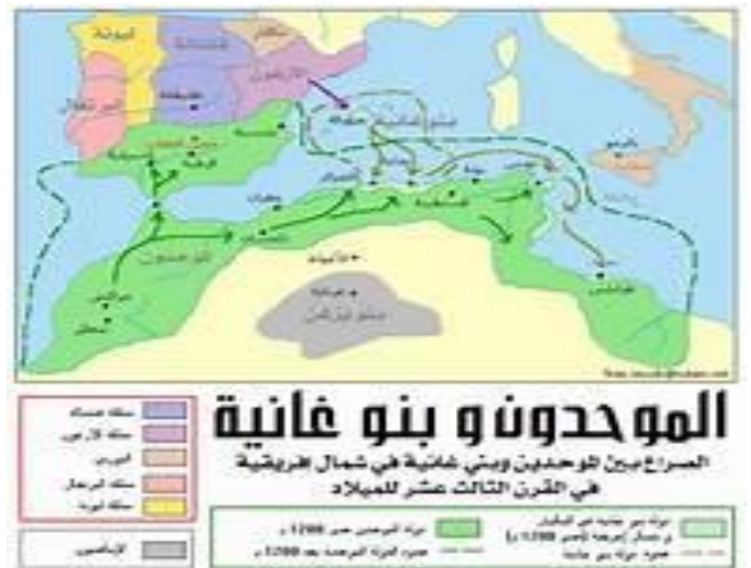
السند : 05