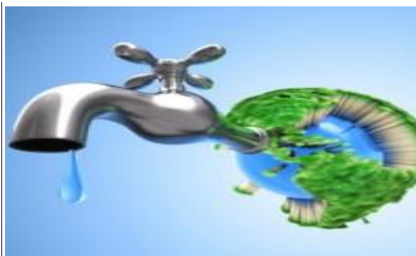
Image N° 01