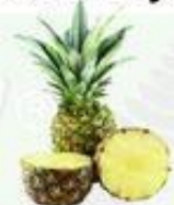
la piña la arañá