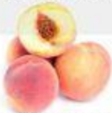
el melocotón el durazno