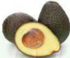
el aguacate la palta