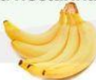
el plátano la banana