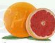
la toronja el pomelo