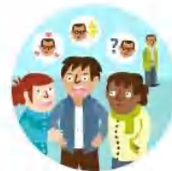
La liberté d'expression