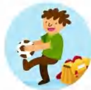
Le jeu et les loisirs