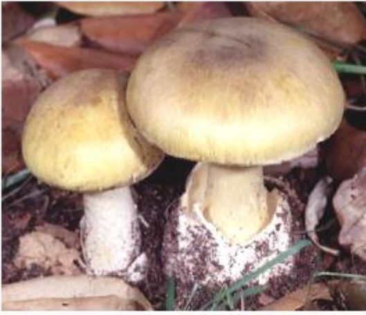
الفطر السام ( Amanita phalloides )