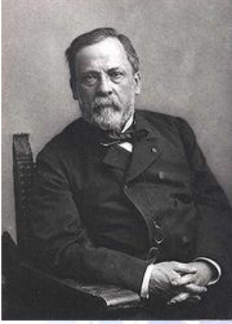
Pasteur باستور 1822-1895

ما يعتقد -، للنفوذ في دواخلها 1 فلا وجود لظاهرة خراج مبدأ السببية والحتمية.