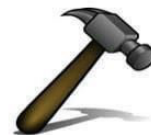
un ..... rteau