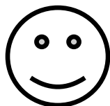
الشكل - 2 -