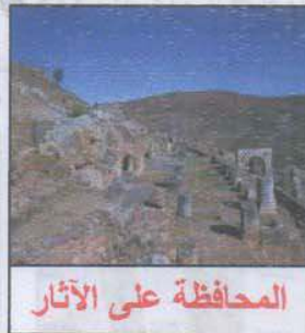
المحافظة على الآثار