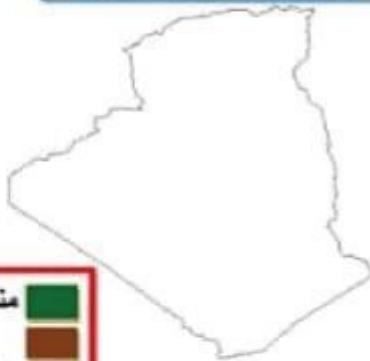
خريطة الأقاليم المناخية في الجزائر

مناخ البحر المتوسط المناخ القاري المناخ الصحراوي