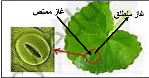
الوثيقة (2) : ملاحظة مجهرية لورقة نبات أخضر

من أجل دراسة بعض الظواهر الطبيعية التي يقوم بها النبات الأخضر إليك الوثائق التالية :