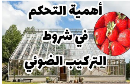
وثيقة (3): فوائد البيوت البلاستيكية