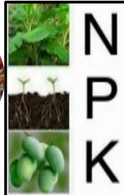
وثيقة (2): محلول كنوب مغذي للنبات

محلول كنوب يتركب من ماء + الأملاح المعدنية الضرورية لنمو النبات الأخضر منها الأزوت ، الفسفور ، البوتاسيوم ويوفر العناصر الأساسية بتركيز مناسب