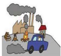
الغبار والغازات السامة

تحب سلمى تربية الحيوانات في البيت فهي تملك قطا و كلبا في البيت.