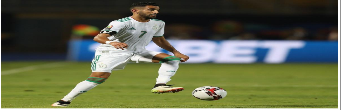
الوثيقة - 1 -

رياض محرز لاعب موهوب و فنان صانع أفراح المنتخب الجزائري و نادي مانشستر سيتي، للحفاظ على لياقته البدنية يتناول راتب غذائي يدعي راتب العمل ( النشاط ).