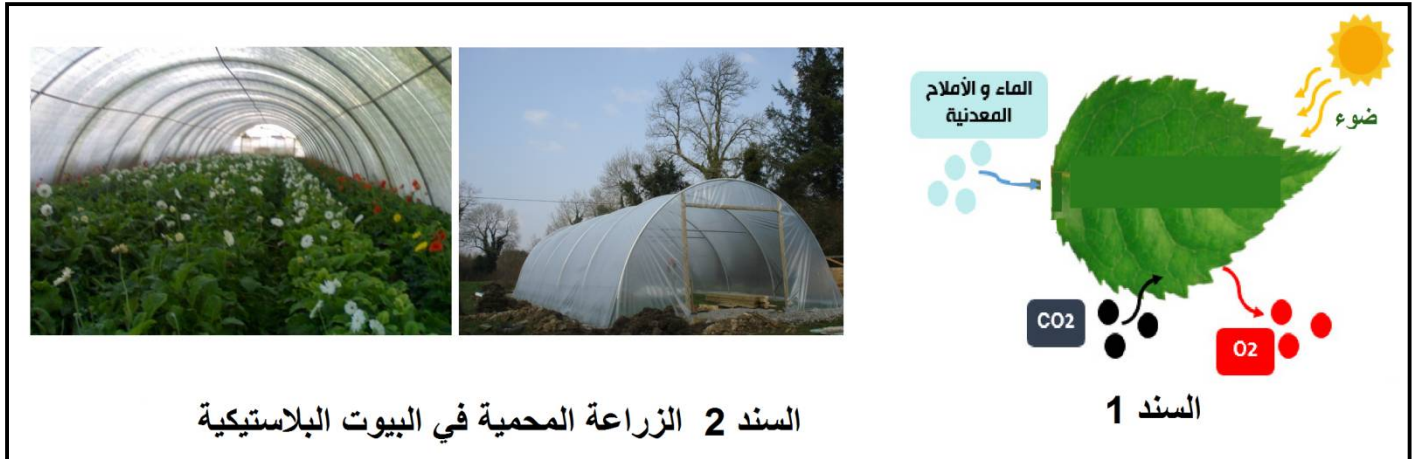
السند 2 الزراعة المحمية في البيوت البلاستيكية

خلال عطلة الربيع زار محمد الذي يدرس بالسنة أولى متوسط وإخوته بيت عمه الفلاح في الريف و الذي يملك أراضي زراعية بها خضر و فواكه منها البرتقال و العنب . بينما كان محمد وإخوته يتناولون تلك الفواكه دار نقاش بينه وإخوته ، إذ أثار انتباهه أخطاء في تصورات إخوته حول مصدر السكر المتواجد في ثمار الفواكه ، و عن نضج فاكهة العنب في الربيع .