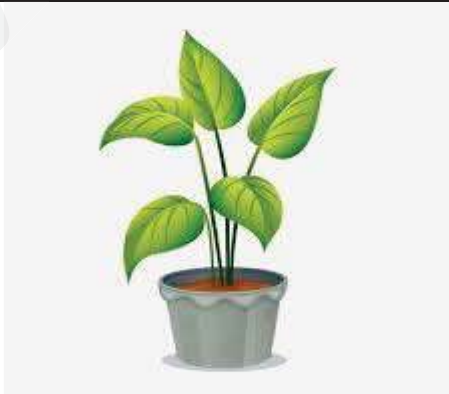
السند (1) : النبات الأخضر

ملاحظة : نبات اللعاعة ( ENDIVE ) نوع من الخس قليل اليخضور .