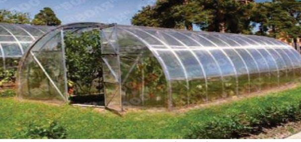
الوثيقة (1) بيت بلاستيكي

الوضعية الأولى (06 نقاط) : في إطار الدعم الفلاحي ، تحصل عمي صالح على 5 بيوت بلاستيكية لتطوير الانتاج الفلاحي في المناطق الريفية . حيث تعتبر البيوت البلاستيكية فتحا جديدا في عالم الزراعة لأنها توفر للنبات الظروف المناسبة لنموه . كما توضح الوثيقة (1)