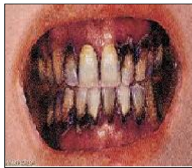
الوثيقة 2: أسنان شخص مدمن