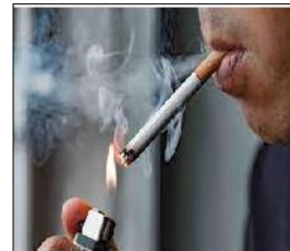
الوثيقة 1: شخص مدمن