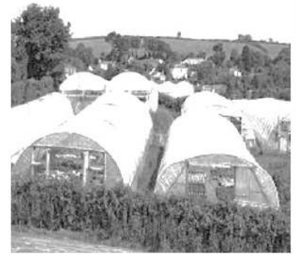
السند 1: الزراعة في البيوت البلاستيكية