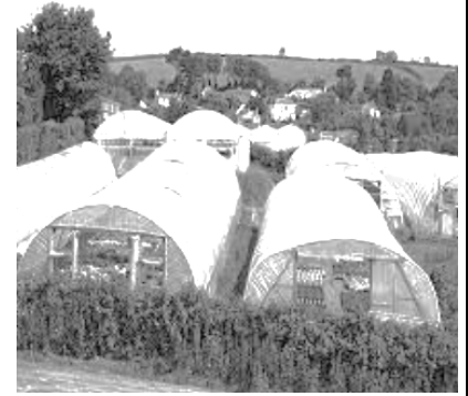
السند 1: الزراعة في البيوت البلاستيكية