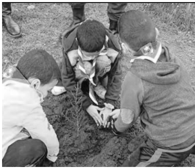
السند 3: عملية التشجير