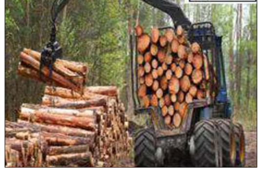
السند 1 : قطع الأشجار