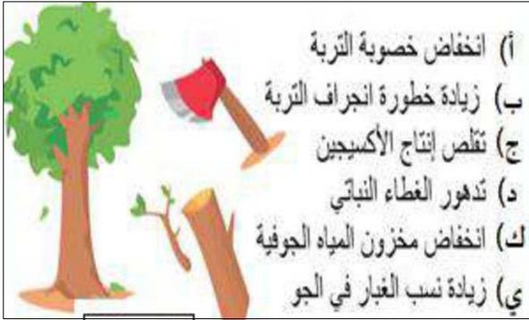
السند 2 : أضرار قطع الأشجار وإزالة الغابات

حيث كانت تختفي كل ست ثوان مساحة من الغابات تعادل مساحة ملعب كرة قدم.