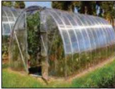
01 - الزراعة في البيوت البلاستيكية

01 - حدد العوامل التي نستطيع التحكم بها في البيوت البلاستيكية وماهي الفائدة منها .