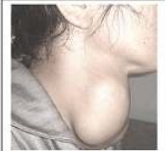
صورة جانبية لامرأة مصابة بالمرض