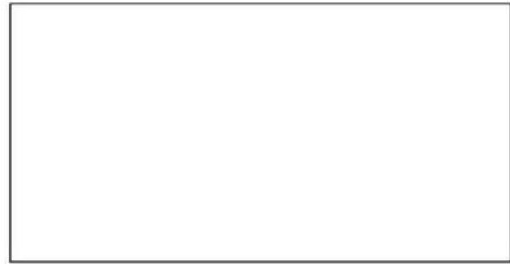
المخطط النظامي لتركيب خالد

2- أذكر طريقة توصيل المصابيح في كل تركيب.