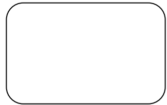
1 الماء المقطر