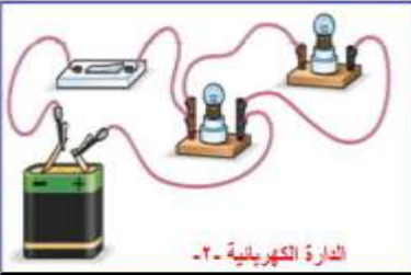
الدارة الكهربائية - ٢ -