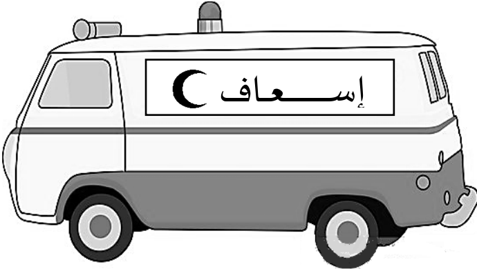
سيارة الاسعاف من الخارج