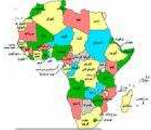
سند قارة إفريقيا