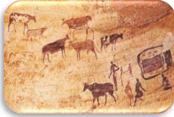
السند 01: رسومات على صخور الطاسيلي

من خلال السياق ومعلوماتك أجب عن التعليمات التالية: