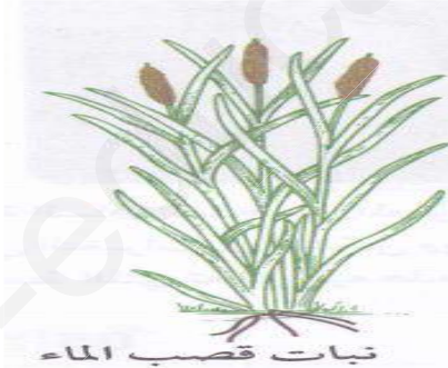
نبات قصب الماء

تمثل الوثيقة التالية رسما لنبات الورد و نبات قصب الماء.