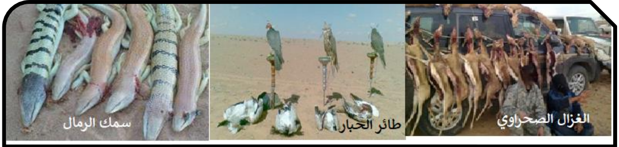
الوثيقة-2- الصيد الجائر للحيوانات النادرة