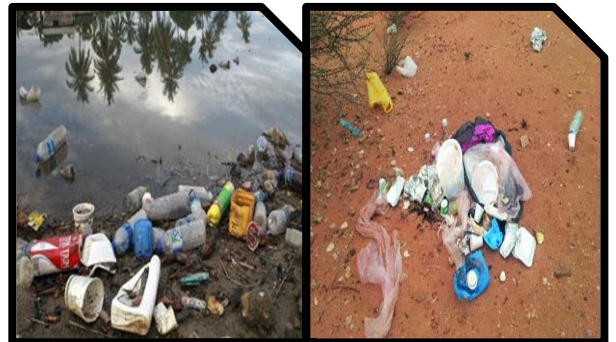
الوثيقة-3- رمي النفايات بعد نزهة الصيد

إعتماداً على ما درست و السندات المرفقة :