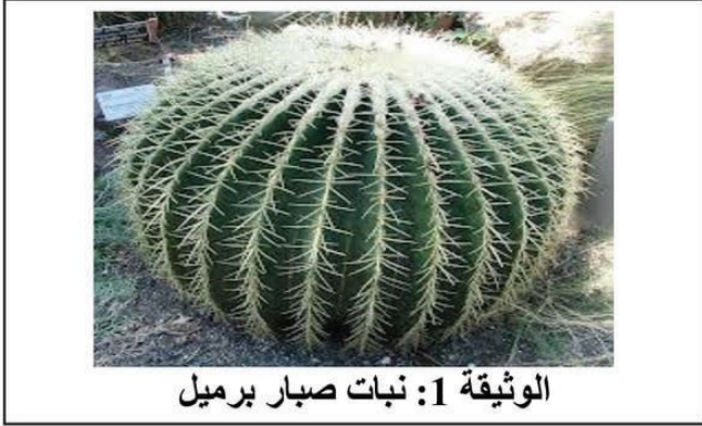
الوثيقة 1: نبات صبار برميل

لتمييز مظاهر تكيف النباتات مع الأوساط الفقيرة من الماء توضح الوثيقة (1) المقابلة نبات يسمى صبار برميل. التعليمات: