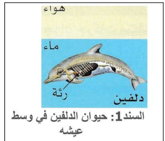
السند1: حيوان الدلفين في وسط عيشه

التعليمات : 1- سم نمط هذه الوظيفة الحيوية عند هذا الحيوان المدروس و وسط عيشه.