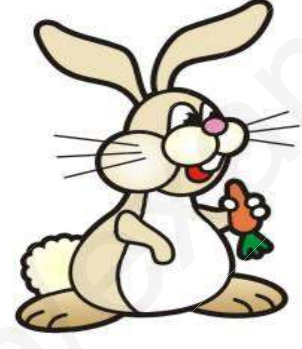
سند1: أرنب يتناول الجزر