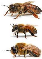
السند - 2