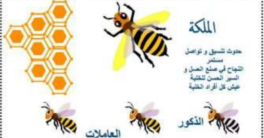
الوثيقة 01 : تجربة أحمد