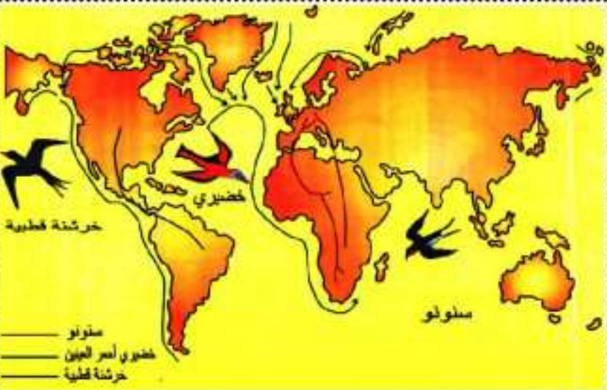
الوثيقة 02 : استراتيجيات المقاومة عند الطيور