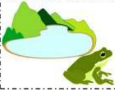
المجموعة : 02