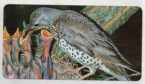
صائر السمان وصغاره