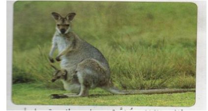
انثى الكنغر مزودة بجراب بطني يحتوي على