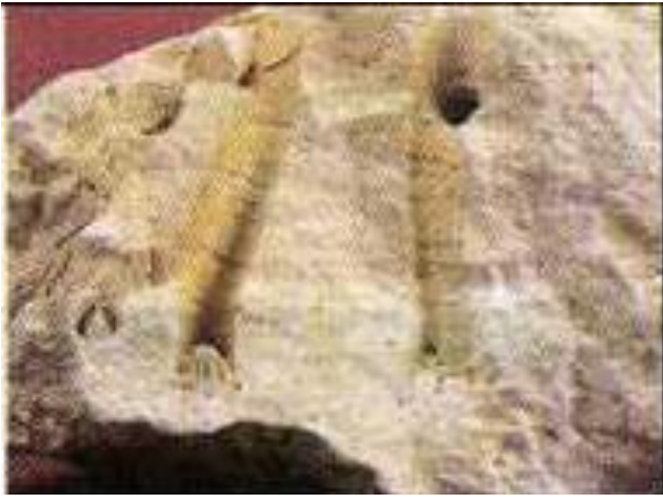
الوثيقة 02: جزء من مستحاثة المرجان

أثناء أشغال البناء العمراني صادف العمال وجود بعض الارصفة المرجانية المتحجرة، قدر علماء المستحاثات عمرها بألاف السنين.