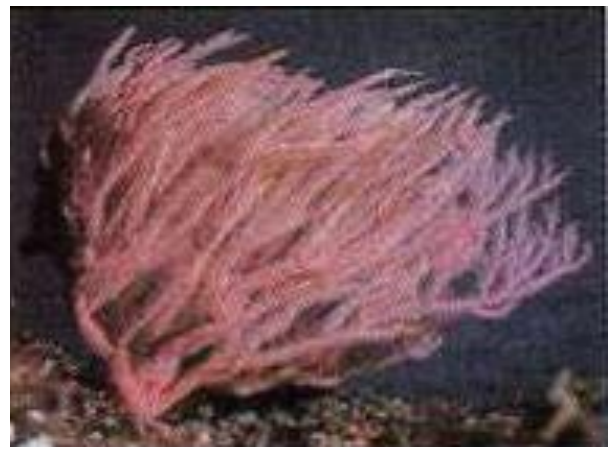
الوثيقة 01: مرجان حالي