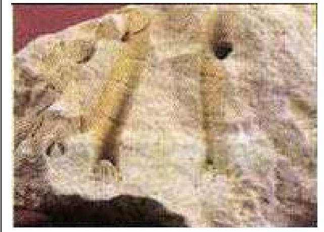
الوثيقة 02: جزء من مستحاثات المرجان الموجودة في بشار

أثناء أشغال البناء العمراني في منطقة بشار صادف العمال وجود بعض الارصفة المرجانية المتحجرة ، قدر علماء المستحاثات عمرها بألاف السنين .