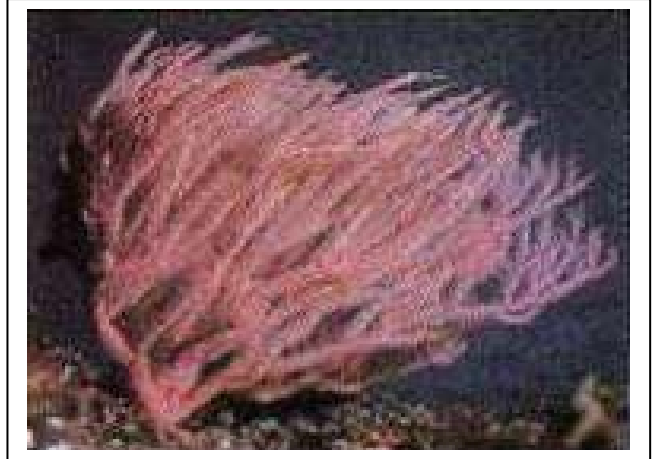
الوثيقة 01: مرجان حالي