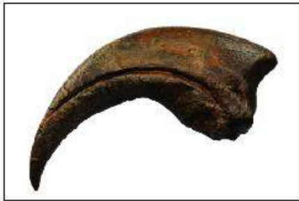
بقايا لمخالب طائر