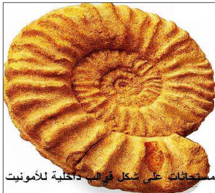
مستحاثات على شكل قوالب داخلية للأمونيت