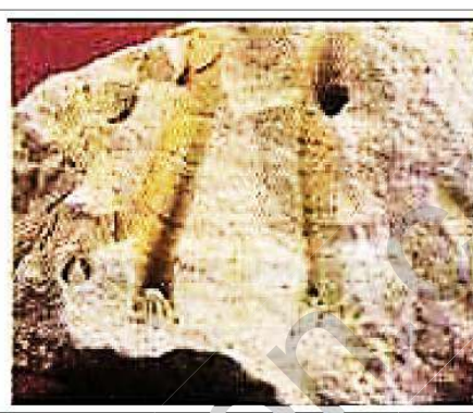
جزء من مستحاثات المرجان