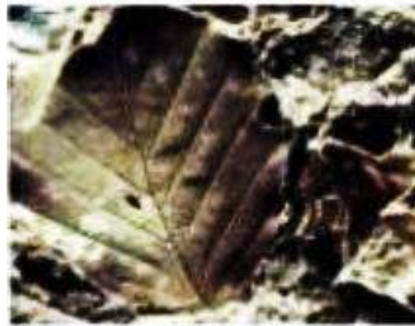
بصمة ورقة نبات