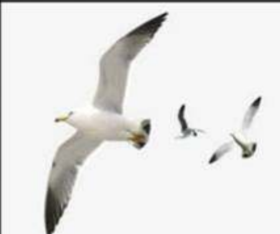
السند 03: بعض المفترسات