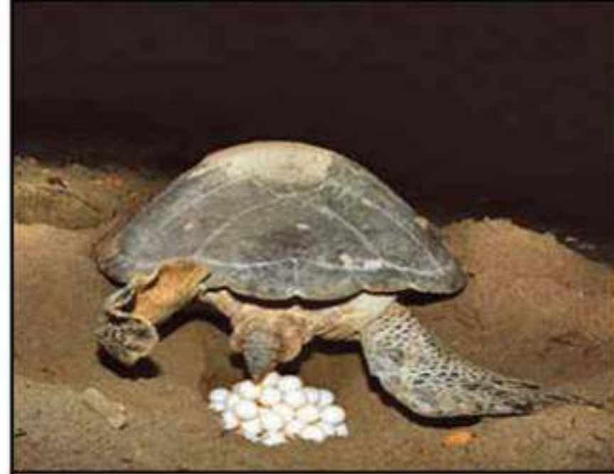
السند 01: سلحفاة تضع البيوض