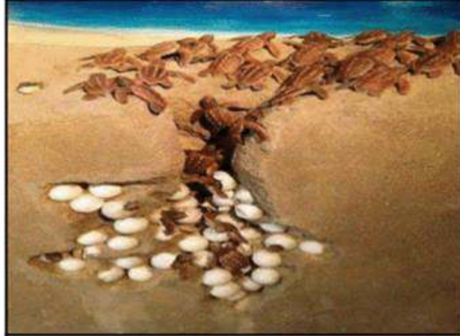
السند 02: سلاحف صغيرة متجهة الى البحر بعد الفقس

ملاحظة: توظيف السندات أمر ضروري. كما يعتبر السياق (النص) من السندات أيضا..... بالتوفيق : الاستاذ د / زهير