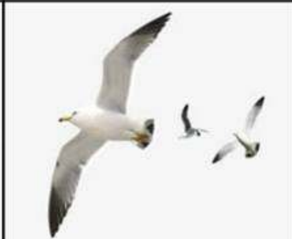
السند 03: بعض المفترسات