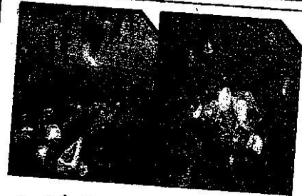
الوثيقة 3:رمي النفايات بعد نزهة الصيد

التعليمات: اعتمادا على مكتسباتك و السندات