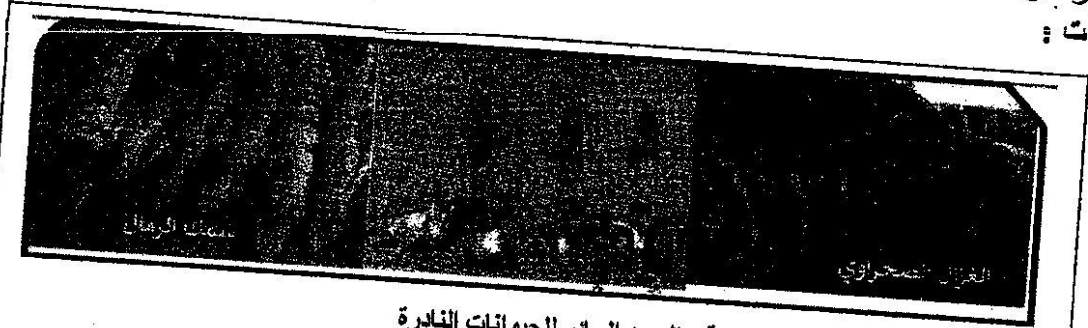
الوثيقة 1:الصيد الجائر للحيوانات النادرة