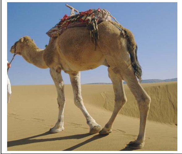
صورة لأحد أنواع الإبل (الجمل العربي)

في هذه الآية الكريمة يخص الله سبحانه وتعالى - الإبل من بين مخلوقاته الحية , ويدعونا إلى التفكير والتأمل في خلقها , باعتبارها خلقاً دالاً على عظمة الخالق - سبحانه وتعالى - وكمال قدرته وحسن تدبيره.